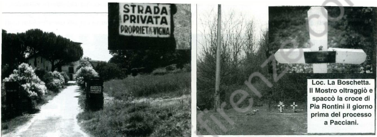
VICCHIO, ZONA BOSCHETTA. - DELITTO DEL 29 LUGLIO 1984

17, 18) c'è una villa con la scritta "Proprietà Vigna". Il messaggio del Mostro è nuovamente di sfida nei confronti del procuratore Vigna, di sprezzo del pericolo e con la solita valenza maniaco religiosa. La ragazza fu ricomposta con la mano destra tesa e chiusa a pugno in cui stringeva i propri abiti (camicetta e canottiera) sporchi del proprio sangue: un'immagine biblica e pittorica d'alto significato di vendetta dove il Mostro si erge ad Angelo della Morte ed ad Angelo vendicatore. Era la prima volta che il Mostro escindeva la mammella sinistra.