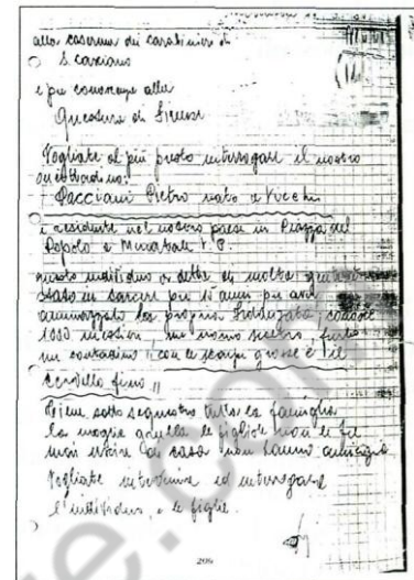
La lettera anonima del 19 sett. 1985 contro Pacciani.

Una combinazione di persone, circostanze, interessi ed azioni ha fatto sì che Pietro Pacciani fosse accusato e incastrato come Mostro di Firenze per poi determinarne la morte a completamento dell'opera. Tale combinazione è stata gestita sapientemente da una mente abilissima e pianificatrice, un soggetto perverso e malefico con manie religiose e sessuali, un soggetto che odia il sesso consumato in situazioni di peccato e in prossimità di luoghi di culto e con immagini religiose, che odia i mezzi anticoncezionali, che organizza riti e azioni "criminal-satanici", che ha avuto un trascorso clericale, che ha inconfessabili manie e desideri sessuali bloccati dall'educazione religiosa, che ha nella sua famiglia soggetti che frequentano gruppi religiosi "speciali" ed "estremi".