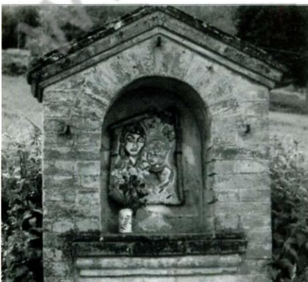
Il tabernacolo a poche centinaia di metri dalla Boschetta (delitto di Vicchio, 29.7.84) e dalla proprietà Vigna: il Mostro sfidava simbolicamente il suo grande cacciatore.

Il delitto del 9 settembre 1983 fu commesso in prossimità di un convento, a pochi metri da un tabernacolo religioso e nella strada che conduce alla Certosa e in altri luoghi di culto: una zona sacra. Le due vittime erano di sesso maschile, quindi, non vi fu escissione di pube femminile e nemmeno composizione dei cadaveri, però, ci fu un'opera rituale di accomodamento delle circostanze: fu preparato un altarino con delle riviste pornografiche "Golden Gay" che esaltavano l'opera di un Grande esecutore di delitti commissionatigli da un tribunale segreto. In tale delitto (il quinto della serie), il Mostro depositò la copertina n° 5 della rivista; la pubblicazione della rivista era iniziata col n° 1 nell'aprile 1981, proprio quando Stefano Mele era uscito di galera: i cinque titoli delle riviste "Golden Gay" sono tutti in linea e significato di scena e di circostanza con i delitti del Mostro di Firenze.